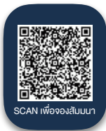
SCAN เพื่อลงทะเบียน